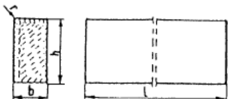
c) wpusty na powierzchniach stykowych krawężników